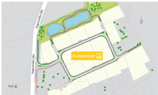
Teilgebiet 1 und 2.PNG