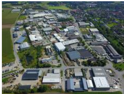
Industriegebiet 170828 (17).JPG