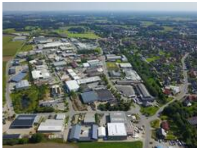
Industriegebiet 170828 (18).JPG