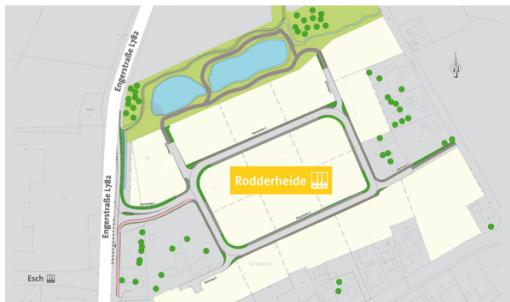
Teilgebiet 1 und 2.PNG