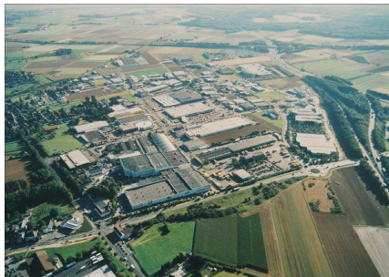
Luftbildaufnahme Gewerbegebiet Aachener Kreuz