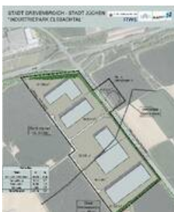
Elsbachtal: Potenzielle Flächen als Platzhalter