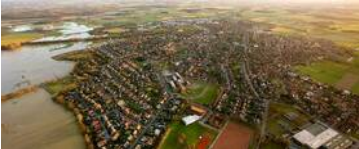
Blick auf die Stadt Olfen. Am linken Bildrand: Die Steveraue