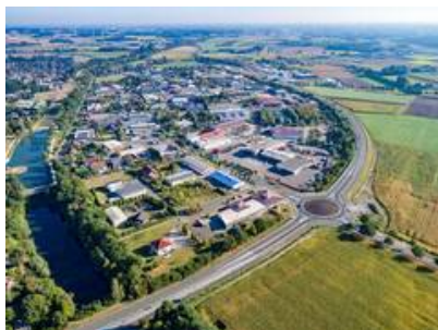
Blick auf das Gewerbegebiet Olfen-Hafen

Dass dies bei den Verantwortlichen in den Unternehmen geschätzt wird, zeigt das stetige Wachstum der Olfener Gewerbegebiete in den vergangenen Jahren. Auch die Zahl der sozialversicherungspflichtigen Arbeitsplätze konnte seit 1999 um 37,5 % gesteigert werden.