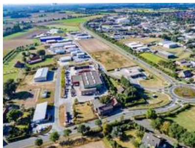
Blick auf das Gewerbegebiet Olfen-Ost. Im Hintergrund: