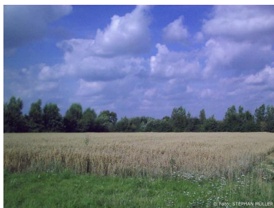
Grundstück neben GLS