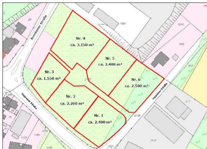
Lageplan Ruhnenpöstchen II.jpg